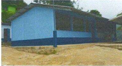
Foto1: Sustitución de lámina, por lámina troquelada alizinc calibre 26 en aula