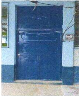
Foto 3: Sustitución de puerta de madera por puerta de metal en aula