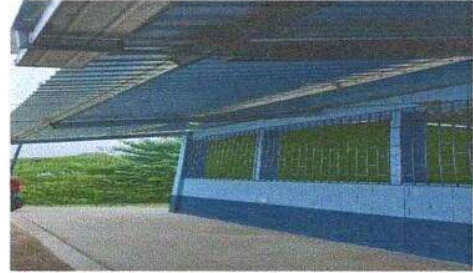
Foto 2: Sustitución de estructura de soporte de madera por metal en aula